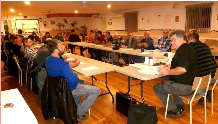
Légende : Rencontre du 12 octobre dernier à Ristigouche-Partie-Sud-Est.

L'expérience sera fort probablement répétée au printemps lors du lancement du PDZA, mais cette fois en ciblant des entreprises agricoles dans le secteur de Matapédia et des Plateaux. À suivre!